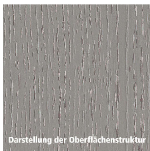
Darstellung der Oberflächenstruktur