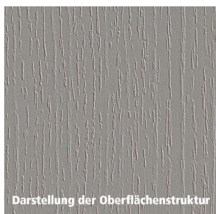
Darstellung der Oberflächenstruktur

Gewicht: 5,6 kg WF00Dekor: Holz WF00Eigenschaften: • kratzfest • strapazierfähig • stoßfest WF00Holzart: Eiche WF00Plattenoberflaeche: MO Montana WF00Verwendungszweck: Innenbereich