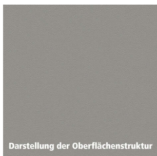
Darstellung der Oberflächenstruktur

Arbeitsplatte aus einer Holzspanplatte Typ P2, die Dekorseite ist mit einem HPL verklebt, die Rückseite mit wasserabweisendem Gegenzug. Die Oberfläche des Schichtstoffs ist kratzfest, lebensmittelecht, wasserfest und pflegeleicht. Als Holzwerkstoff sind unsere Arbeitsplatten leicht zu verarbeiten und einzubauen.