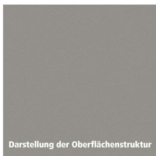
Darstellung der Oberflächenstruktur

Gewicht: 61,32 kg WF00Eigenschaften: lebensmittelecht WF00Kantengestaltung: Postforming Kante WF00Verwendungszweck: Innenbereich Arbeitsplatte aus einer Holzspanplatte Typ P2, die Dekorseite ist mit einem HPL verklebt, die Rückseite mit wasserabweisendem Gegenzug. Die Oberfläche des Schichtstoffs ist kratzfest, lebensmittelecht, wasserfest und pflegeleicht. Als Holzwerkstoff sind unsere Arbeitsplatten leicht zu verarbeiten und einzubauen.