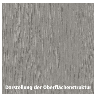
Darstellung der Oberflächenstruktur