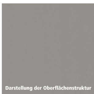
Darstellung der Oberflächenstruktur