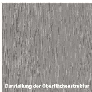
Darstellung der Oberflächenstruktur

Gewicht: 6,96 kg WF00Dekor: Holz WF00Eigenschaften: • kratzfest • strapazierfähig • stoßfest WF00Verwendungszweck: Innenbereich