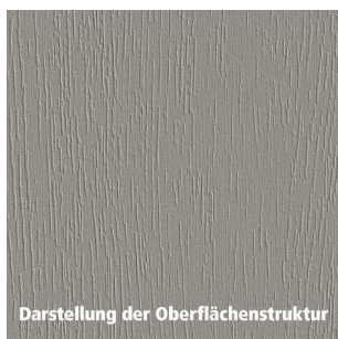
Darstellung der Oberflächenstruktur