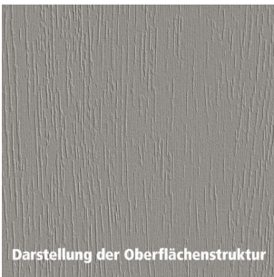
Darstellung der Oberflächenstruktur