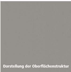
Darstellung der Oberflächenstruktur