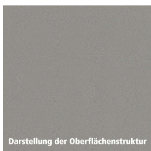
Darstellung der Oberflächenstruktur

Gewicht: 6,96 kg WF00Dekor: Holz WF00Eigenschaften: • kratzfest • strapazierfähig • stoßfest WF00Holzart: Kirschbaum WF00Verwendungszweck: Innenbereich