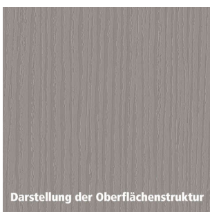
Darstellung der Oberflächenstruktur

Gewicht: 5,54 kg WF00Dekor: Holz WF00Eigenschaften: • kratzfest • strapazierfähig • stoßfest WF00Holzart: Kiefer WF00Verwendungszweck: Innenbereich