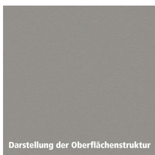
Darstellung der Oberflächenstruktur

Gewicht: 6,96 kg WF00Dekor: Design WF00Eigenschaften: • kratzfest • strapazierfähig • stoßfest WF00Verwendungszweck: Innenbereich