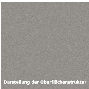
Darstellung der Oberflächenstruktur