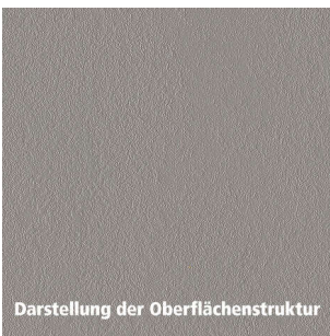
Darstellung der Oberflächenstruktur