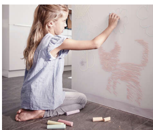
BESCHREIBBAR MIT KREIDE