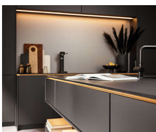
SOFT-TOUCH UND ANTI-FINGERPRINT