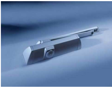
TS90 Impulse EN3/4