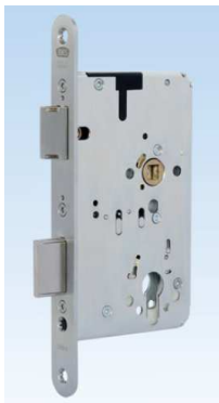
Panik - Einsteckschloss 2326

Beide Verschlusselemente werden dabei zurückgezogen.