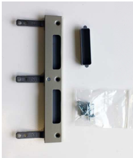
Grauhoff Austauschset WE- Schließblech für Standard- Zargen

Austauschset "WE-Schließblech 190" neusilber farbig zur bauseitigen Umrüstung einer Standard-Zarge zu einer WE- Zarge für schwere Türen oder Wohnungseingangstüren. DIN rechts- links verwendbar