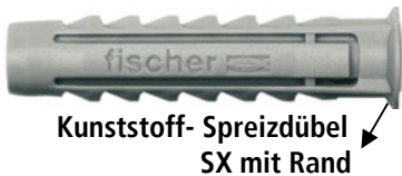
Kunststoff- Spreizdübel SX mit Rand