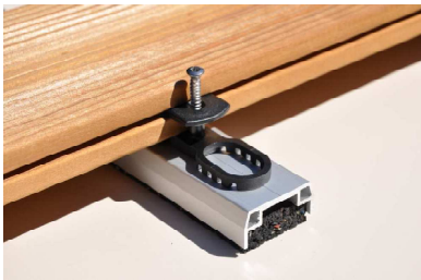
Abstandshalter Terraflex auf Isostep Profilunterlage

flexibler Spannungsbereich von 5,5 - 11,5 mm unsichtbare Befestigung Abstandshalter zwischen den Dielen 7 mm Abstandshalter zwischen den Dielen und der Unterkonstruktion 6 mm konstruktiver Holzschutz durch Unterlüftung der Dielen schnelle Montage: kein Vorbohren nur eine Schraube je Diele und Unterkonstruktion immer gleiches Verlegebild für alle Dielen mit einer Stärke von 20 - 26 mm und einer mittigen Nut von 4 mm (mind. 9 mm tief) inkl. Edelstahlschrauben keine Schrauben von oben in der Diele sichtbar die Dielen sind jederzeit schnell ohne Beschädigung zu demontieren das Quellen und Schwinden der Dielen ist möglich pro qm werden ca. 15 Stück Terraflex benötigt