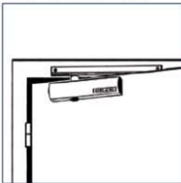
TS 5000 Türblattmontage/Bandseite