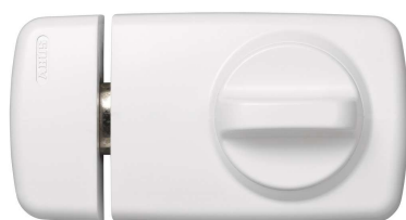
Tür Zusatzschloss 7010 reinweiss