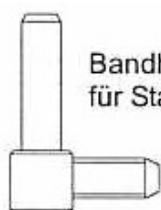
Bandhaken für Stahlzargenband