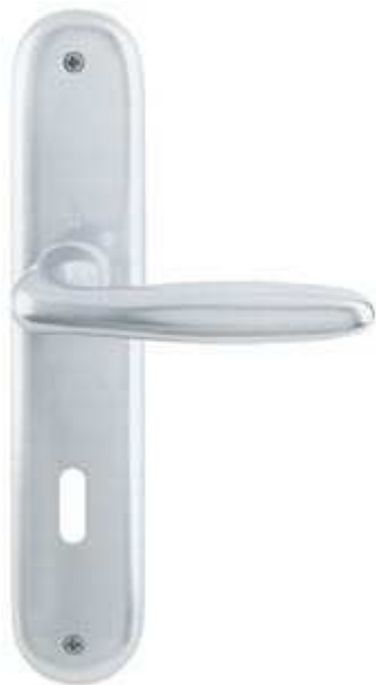
Hoppe Verona 1510/273P/F1

HOPPE-Aluminium-Innentür-Langschild-Garnitur (Türgriff-Garnitur): geprüft nach DIN EN 1906 (Benutzungs- Kategorie 3), Türgriffe mit HOPPE-Schnellstift-Verbindung (mit HOPPE-Vollstift) und Rückholfeder, Schilder sichtbar verschraubt.