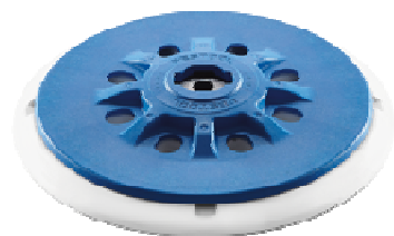
Schleifteller ST-STF D150/17FT- M8-H-HT, hart