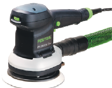
Exzenterschleifer ETS 150/3EQ – Plus