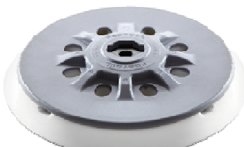
Schleifteller ST-STF D150/17FT- M8-SW, superweich