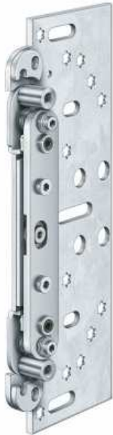
SIMONSWERK VARIANT VX2502 3D N