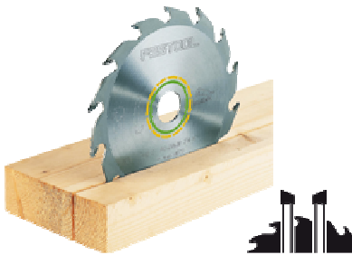
Panther- Sägeblatt 160x2,2x20 PW12