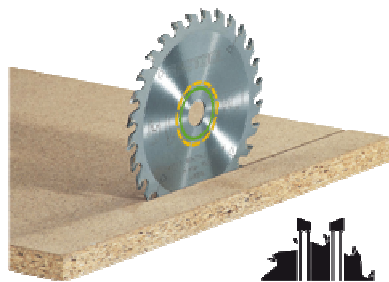
Universal- Sägeblatt 160x2,2x20 W28

Wechselzahn-Sägeblatt PW die Zähne sind bei diesem Blatt im Wechsel nach links und rechts abgeschrägt und schneiden im Wechsel. Das Wechselzahnsägeblatt ist das Universalblatt für alle Holzwerkstoffe