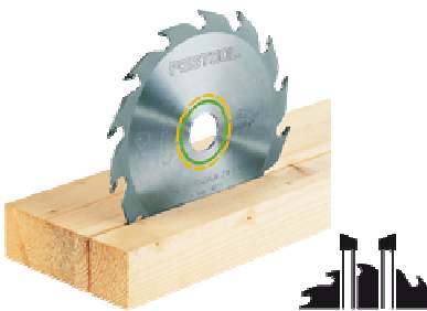
Panther- Sägeblatt 210x2,6x30 PW16