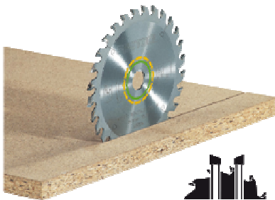
Universal- Sägeblatt 210x2,4x30 W36

Wechselzahn-Sägeblatt PW die Zähne sind bei diesem Blatt im Wechsel nach links und rechts abgeschrägt und schneiden im Wechsel. Das Wechselzahnsägeblatt ist das Universalblatt für alle Holzwerkstoffe