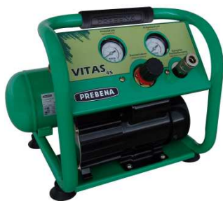
Kompressor Vitas 45

Ölfrei, kein Ölwechsel, kein Öl im Kondenswasser.