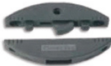
Lamello Clamex S11 Kunststoffriegel 66x29x8mm