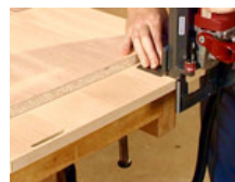
Einbau von Clamex S

Lösbare Verbindungen Ausrichten und Verbinden, 2 Funktionen in einem Verbinder Maximale Ästhetik durch minimale Öffnung zum Schließen und Öffnen der Verbindungen Verdrehsicher durch Führungsstifte, Vielfältige Gehungverbindungen möglich Stapelbar, da keine vorstehenden Teile auf der Fläche Einfaches Einbauen mit jeder Lamello Nutfräsmaschine, Geringe Investitionskosten Einsetzbar in Massivholz und allen Holzwerkstoffen Einbautoleranz seitlich +/- 0,5 mm (max. +/- 0,75 mm), Aus glasfaserverstärkten Kunststoff, schwarz