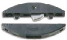
Lamello Clamex S18 Metallriegel 66x29x8mm