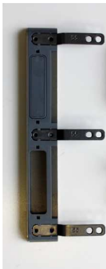
Grauhoff Austauschset für Ganzglastüren