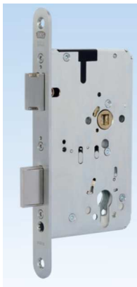
Panik - Einsteckschloss 2320

Einstellbare Panikseite (einwärts / auswärts) Obenverriegelung adaptierbar