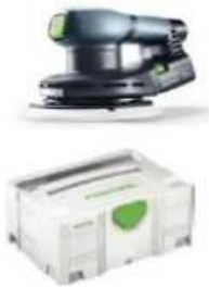
Exzenterschleifer ETS EC 150/5EQ – Plus