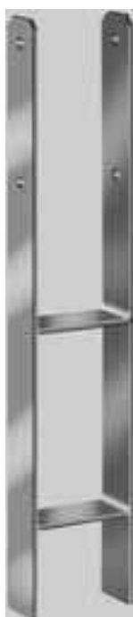
Pfostenanker Typ. H

Zur Montage von schweren Holzkonstruktionen, z.B. Carports, Pergolen, Windschutzzäune usw.