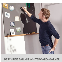
BESCHREIBBAR MIT WHITEBOARD-MARKER