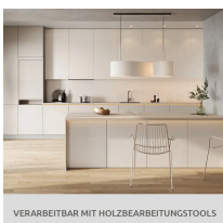
VERARBEITBAR MIT HOLZBEARBEITUNGSTOOLS