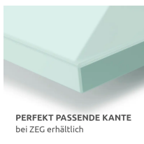
PERFEKT PASSENDE KANTE bei ZEG erhältlich