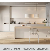
VERARBEITBAR MIT HOLZBEARBEITUNGSTOOLS