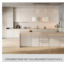
VERARBEITBAR MIT HOLZBEARBEITUNGSTOOLS