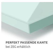
PERFEKT PASSENDE KANTE bei ZEG erhältlich