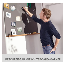
BESCHREIBBAR MIT WHITEBOARD-MARKER