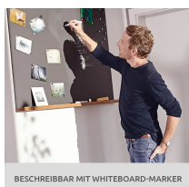
BESCHREIBBAR MIT WHITEBOARD-MARKER